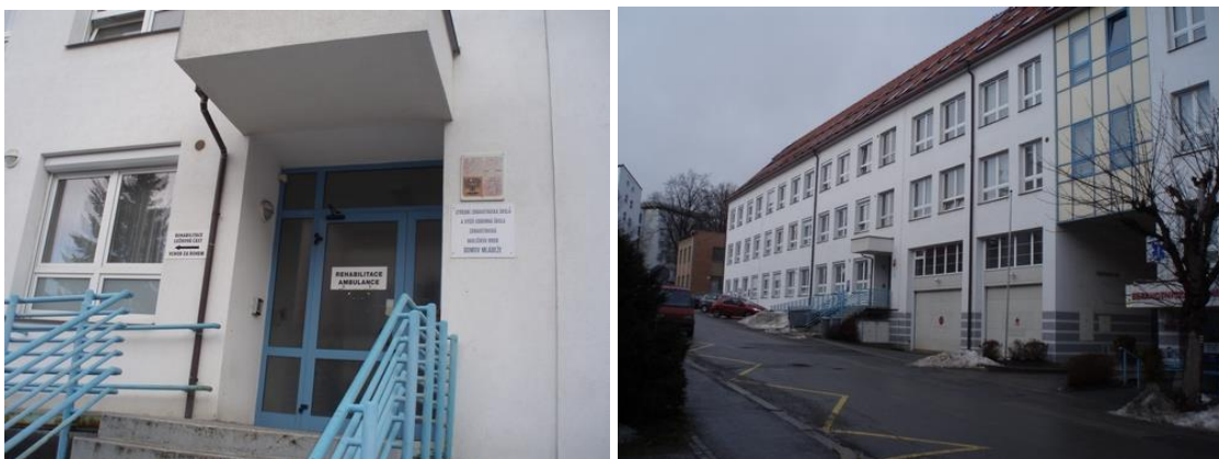
Vchod do budovy a celkový pohled na budovu Domova mládeže

Domov mládeže je součástí Střední zdravotnické školy a Vyšší odborné školy zdravotnické v Havlíčkově Brodě. Poskytuje ubytování a stravování žákům této školy, případně dle zájmu a možností i žákům jiných škol. Umístování žáků do domova mládeže se řídí platnou legislativou. Obsah výchovně-vzdělávací činnosti navazuje na obsah výchovně-vzdělávací práce školy. Současně domov nabízí zájmové vzdělávání, jehož organizace se liší od vzdělávání školy. V domově je také umístěna školní jídelna – výdejna stravy.