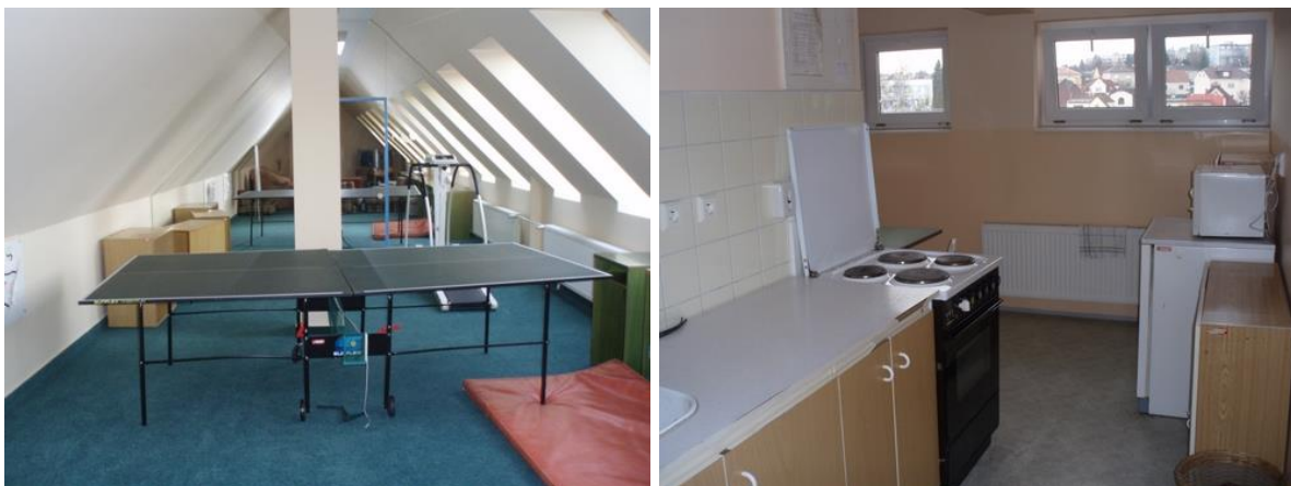
Sportovní vybavení, kuchyňka