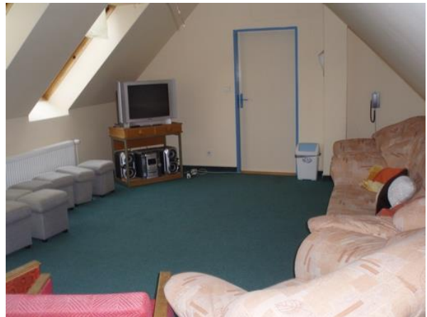
Klubovna a učebna psychologie s televizí