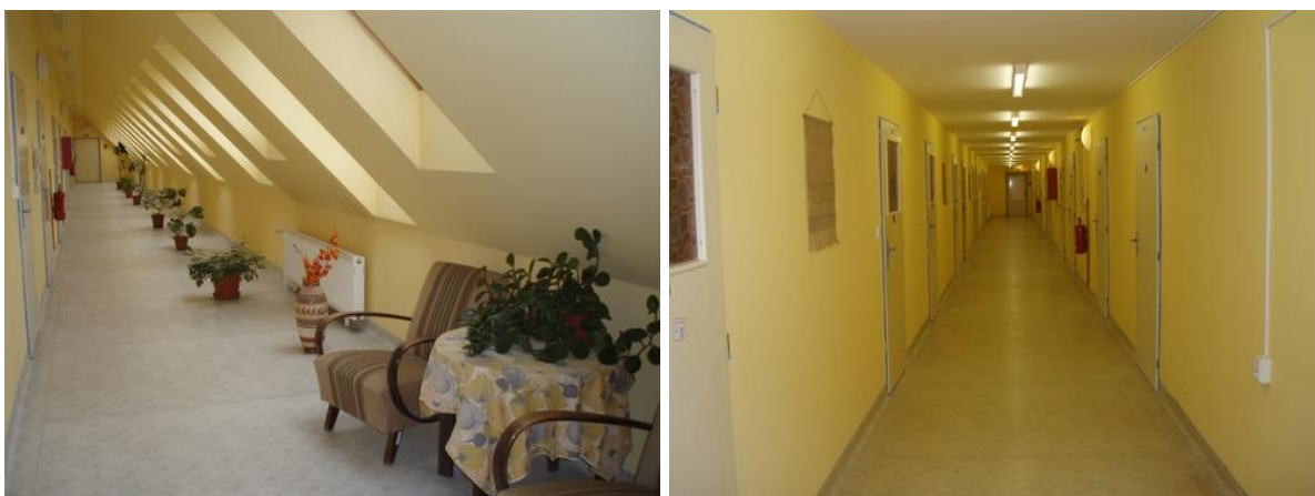
Vnitřní prostory – chodby

Pro přezouvání ubytovaných slouží prostory s uzamykatelnými skříňkami pro uložení obuvi. Ve druhém patře je umístěna výdejna stravy a jídelna. Kapacita jídelny je 54 míst, je možnost ji mimo dobu stravování využívat jako společenskou místnost s klavírem, televizorem a videopřehrávačem. Ve výdejně stravy je zařízení na ohřev jídla, myčka, lednice a prostor na umývání a úklid nádobí. Zde se nachází i kancelář pro řešení finanční stránky stravy a ubytování, přihlášení a odhlášení stravování apod.