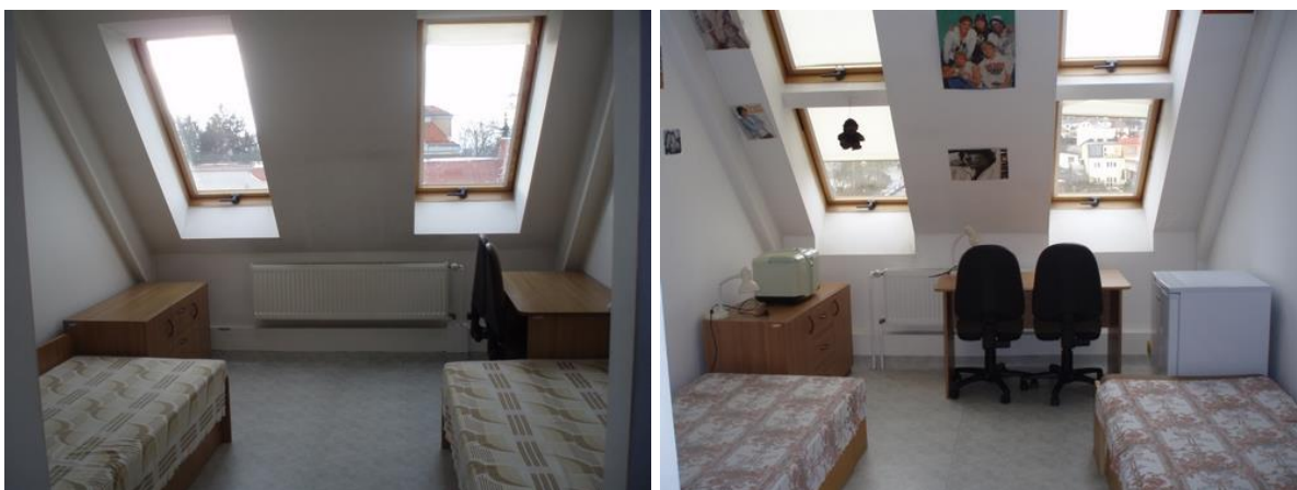
Pokoje a jejich vnitřní vybavení