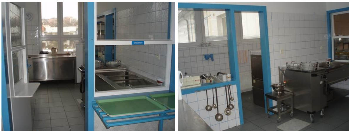
Kuchyň – výdejna stravy

Do domova dochází také domovník školy, který má na starost drobné opravy a údržbu, obsluhu kotelny domova apod.